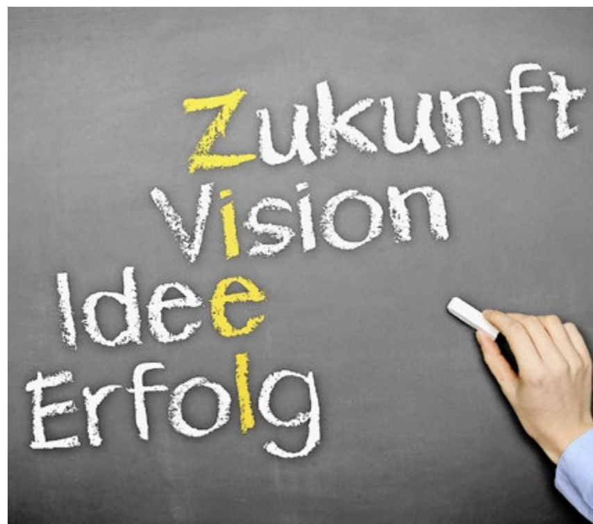
Dank «Innovativi Puure» Ihre Ziele erreichen.

Es geht daher nicht an, dass die Landwirtschaft pauschal für das aktuelle Artensterben direkt verantwortlich gemacht wird und unter dieser Behauptung überrissene ökologische Forderungen gestellt werden. Der ZBV fordert bei jeder Gelegenheit, die Problematik des Artenschwundes in grössere Zusammenhänge zu stellen und Entwicklungen, wie sie in der Tabelle dargestellt sind, mit zu berücksichtigen. Der Landwirtschaft ständig den schwarzen Peter zuzuspielen, ist unsachlich und unfair. ■