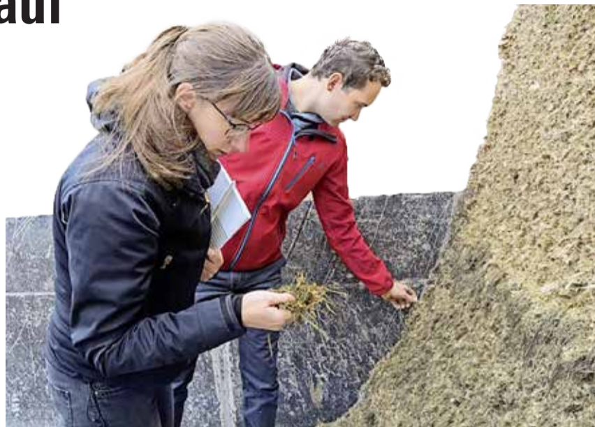
Dank dem Austausch von Wissen und Erfahrungen entstehen praxisnahe Konzepte, Lösungen und Diskussionsgrundlagen für die Betriebsentwicklung, die Forschung und die Politik.

Das Projekt ermöglicht die kostenlose Analyse von Grundfutter, Boden und Gülle. Denn die genaue Kenntnis der eigenen Futter- und Hofdüngerhalte ist zentral für deren gezielten Einsatz.