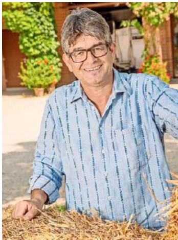
Als aktiver Bauer wird sich der neue Präsident zum Wohl der Zürcher Bauernfamilien engagieren.