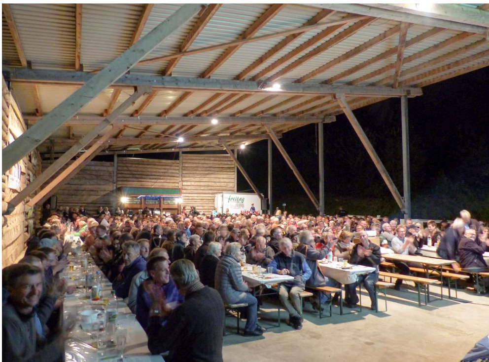
Der ZBV lanciert zusammen mit rund 500 Bäuerinnen und Bauern die Wahlkampagne „3-Martin-nach-Bern“ anlässlich des vierten Puure-Höcks in Rikon.