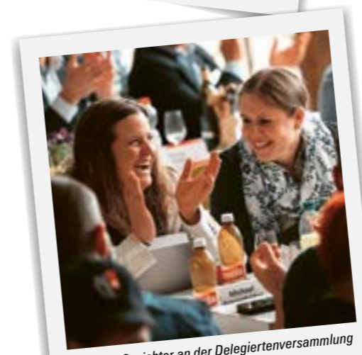
Fröhliche Gesichter an der Delegiertenversammlung des ZBV im April.