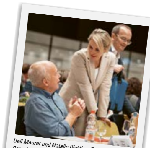
Ueli Maurer und Natalie Rickli im Gespräch, Delegiertenversammlung ZBV.