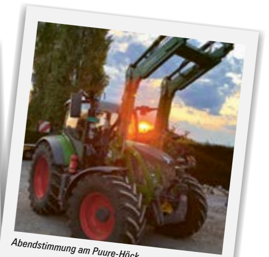
Abendstimmung am Puure-Höck.