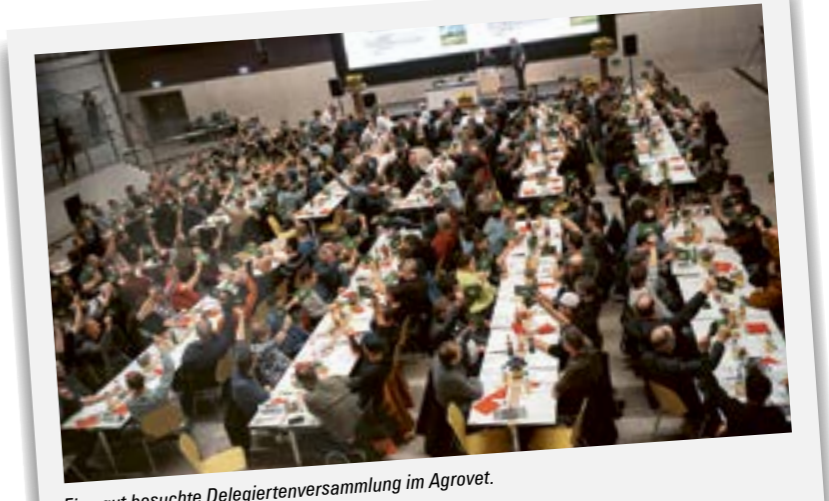
Eine gut besuchte Delegiertenversammlung im Agrovet.