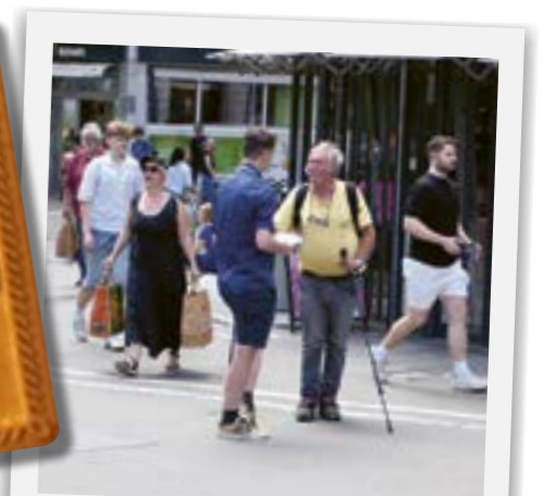
Der ZBV in der Stadt: Tirggel-Verkauf in Zürich-Stadelhofen zugunsten der Gemeinde Blatten.